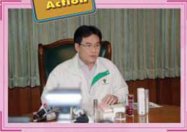
นายจรินทร์ ลักษณวิศิษฏ์ รัฐมนตรีว่าการกระทรวงสาธารณสุข พร้อมด้วยเลขาธิการฯ อย. และ รองเลขาธิการฯ อย. แถลงข่าว การตรวจจับเครื่องสำอางผิดกฎหมาย โฆษณาไอ้อวดสรรพคุณเกินจริง ณ ห้องประชุมชั้น 4 อาคาร 1 ตึกสำนักงานปลัดกระทรวงสาธารณสุข เมื่อวันที่ 19 มีนาคม 2553